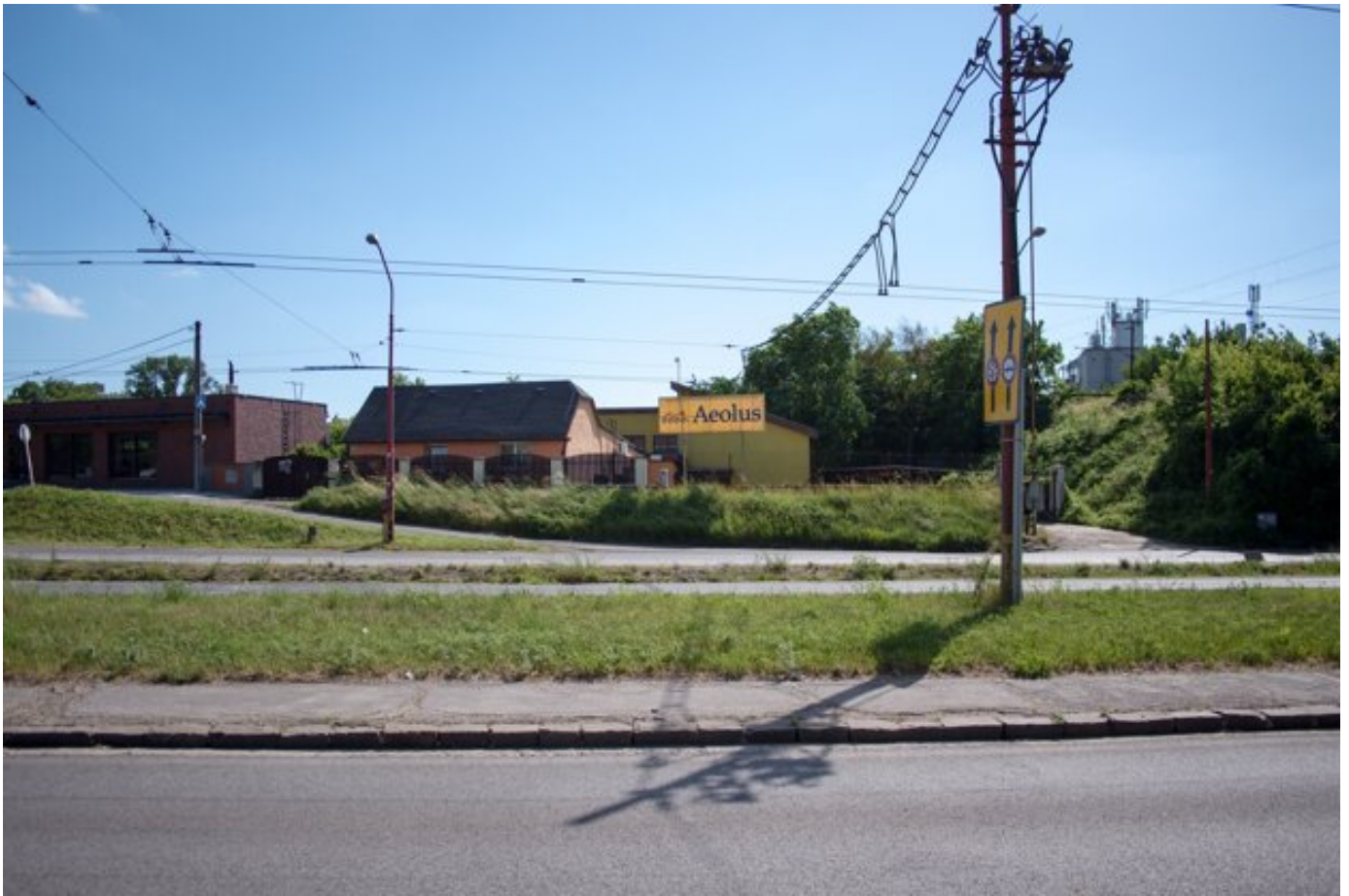
Budova Aeolusu, ktorá skončila v dražbe.

V nasledujúcom roku Aeolus vykázal najväčšie tržby vo svojej histórii, prvýkrát prekonal hranicu 13 miliónov eur.